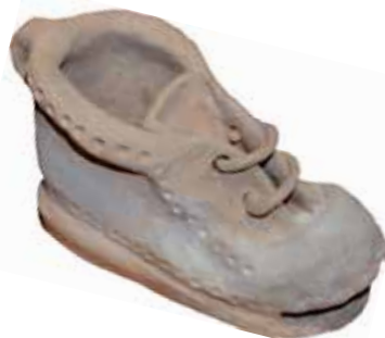
Glineni bočkor za 3 pohodnike, ki so bili v letu 2018 na vseh 43 pohodih, vpisanih v Izkaznico pohodov po Goričkem

Goričko društvo za lepše vütro je v letu 2019 izdalo že jubilejno 10. Izkaznico pohodnika/pohodnice po Goričkem. Letos je v izkaznico iz območja Goričkega in njegovega obrobja vključenih 40 pohodov. V omenjeni izkaznici je tudi 10 pohodov občine Puconci. Namen izkaznice je koordinacija pohodov, gibanje v naravi, spoznavanje naravnih in kulturnih danosti Goričkega ter druženje. Z veseljem ugotavljamo, da zanimanje za pohode narašča in se rekreacije željni obiskovalci odpravljajo k nam tudi že organizirano z avtobusi in kombiji. Vabljeni, da se nam na pohodih pridružite, kajti vsakemu udeležencu, ki je letno prisoten na 10 ali več pohodih, društvo izda priznanje. Najzvestejšim pohodnikom v letu 2018, ki jih je bilo 53, so bila tako na