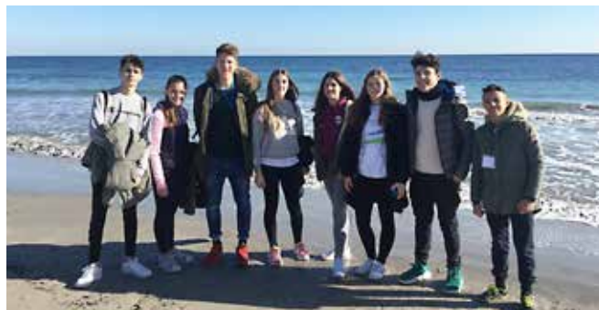
Sprehod ob Sredozemski obali