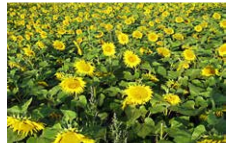
Polje sončnic, ki čebelarjem zagotavljajo medicino in cvetni prah.

jemo sončnice, buče, ajdo, mak, oljno ogrščico, facelijo, deteljo ... Te rastline ne bodo omogočale le pašo čebelarjem, ampak bodo koristne tudi širše. Npr. semena sončnic in buč lahko pozneje uporabimo za izdelavo olja. Ajda, ki jo sejemo poleti, v času cvetenja čebelarjem omogoča pašo, ko dozori, jo požanjemo in pridobimo moko. Tudi ostale medovite rastline niso uporabne le za čebele, ampak po končanem cvetenju, žetvi, se ostali zeleni deli rastlin podorjejo in s tem obogatimo tla s humosom. S tem nahranimo milijone drobnih organizmov v tleh in izboljšamo zračnost ter strukturo tal. Tako s tem ravnanjem zemljo obogatimo. Rastline, ki jih nato posejemo na to zemljo, bodo bolj močne, zdrave in tudi odporne na stres, ki je v zadnjem času vse bolj pogost. S tem mislimo na neugodne vremenske pogoje in posledično tudi na bolezni in škodljivce.