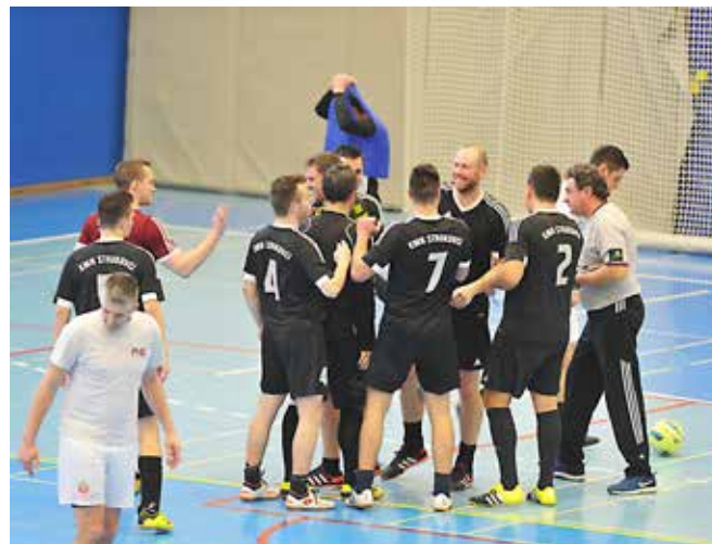
Strukovci (v črnem) so tako kot lani postali prvaki zimske lige OZ KMN Puconci.