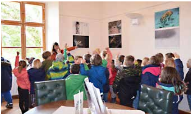
Osnovna šola Grad na otvoritvi fotografske razstave Magična narava.