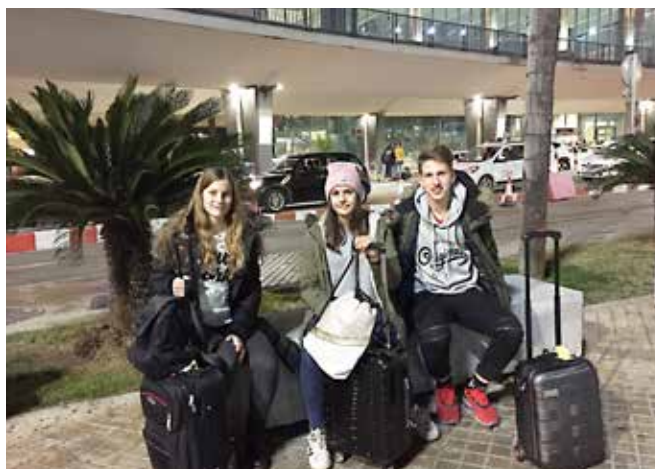
Prihod v Valencio

Na pot smo se podali 7. januarja. Tam so nas sprejele družine, pri katerih smo preživeli teden. Vsak dan smo imeli skupne različne dejavnosti in obiskali veliko znamenitosti v okolici tega mesteca. Spoznali smo njihov način življenja, okusili njihovo hrano, šolsko življenje in še bi lahko naštetela. Najbolj zanimivo pa ni bilo samo dogajanje in obiskovanje znamenitosti, temveč tudi