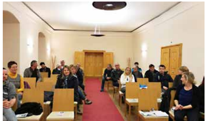
Srečanje imetnikov kolektivne blagovne znamke KPG