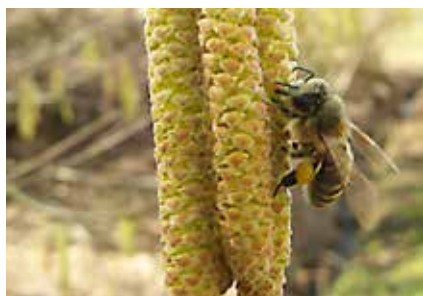
Leska – medoviti grm, ki nas jeseni razveseljuje s svojimi plodovi – lešniki.

Če imamo veliko prostora na vrtu, se lahko odločimo za zasaditev medovitih dreves kot so lipa, divja češnja, navadna leska, kostanj in še mnogo drugih medovitih dreves. Na vrtovih se lahko odločimo tudi za posaditev grmov kot so vrtnice, ki nam s cvetenjem obogatijo naš vrt. Na vrtovih imamo možnost posaditve tudi medovitih začimb in dišavnic.