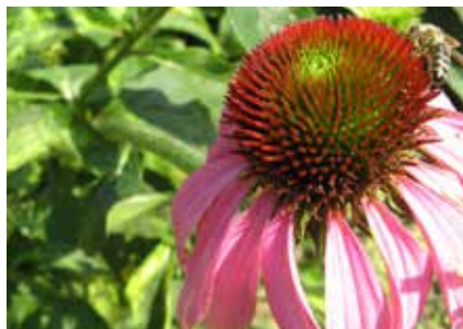
Ena od medovitih rastlin je ameriški slamnik.

To je odvisno od tega kaj imamo na razpolago, ali je to le balkon na katerem imamo cvetlična korita, morda vrt, njiva ali pa so to javne površine. V cvetličnih koritih na balkonu imamo številne možnosti pri izbiri medovitih rastlin tako iz vrst začimb kot dišavnic. V korita lahko sadimo baziliko, origano, timijan, meliso, borec kot tudi nizko sončnico ali ameriški slamnik in še bi lahko naštevali.