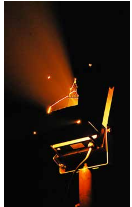
Maska pred svetilko s silhueto cerkve v Bodoncih

Gregor Domanjko, besedilo in fotografija